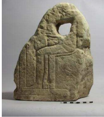
Fot. 5 Fragment reliefowanego bloku kamiennego ze świątyni wtórnie użytego w stajni (fot. C. Baka)

wzięto z rozbiórki świątyni boga Atuma, o której istnieniu wiadomo z wykopalisk prowadzonych w Tell el-Retaba ponad 100 lat temu. Świątynia ta została zbudowana przez Ramzesa II w czasach Nowego Państwa. Nie dotrwała jednak, a przynajmniej nie w całości, do Trzeciego Okresu Przejściowego, kiedy to powstała stajnia.