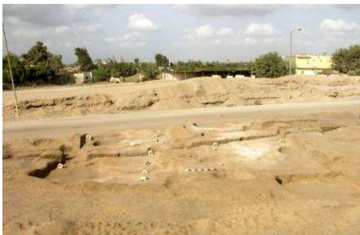
Fot. 4 Widok na stajnię

W miejscu, w którym na podstawie wcześniejszych badań geofizycznych spodziewano się znaleźć starożytną drogę, odkryto kompleks pomieszczeń przeznaczonych dla zwierząt. Największe z nich zostało zidentyfikowane jako stajnia, z dwoma rzędami wpuszczonych w podłogę kamieni (w sumie było ich ponad 20), do których wiązane były konie. Dotychczas nie były znane podobnego typu budowle z Trzeciego Okresu Przejściowego. Z czasów Nowego Państwa najbliższych analogii dostarczają królewskie stajnie w Qantir i stajnie/obory w pałacu północnym w Tell el-Amarna.