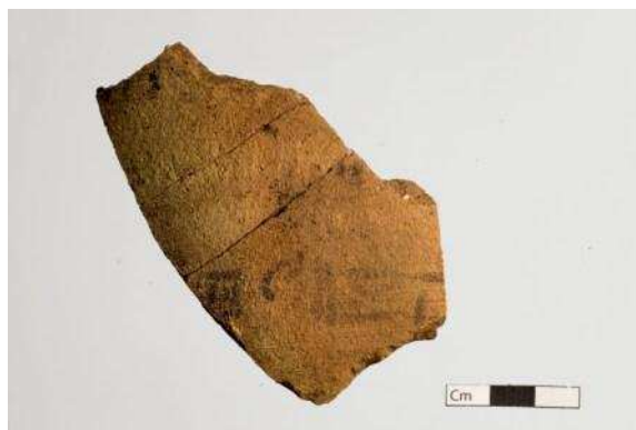
Fot. 6 Fragment skorupy z podpisem hieratycznym

Przy murze twierdzy z czasów Ramzesa II odkryto dwa duże (3,5 na co najmniej 13 m) pomieszczenia. Wygląda na to, że odkopany został fragment koszar, w których mieszkała załoga twierdzy. Wewnątrz znaleziono m.in. piec, żarna, pozostałości trzcinowej maty rozłożonej na podłodze. Wśród znalezisk drobnych warto wspomnieć o licznych fragmentach amfor na wino, w tym jednym z hieratyczną "etykietą", a także o dużej liczbie skrobaczek wykonanych z kawałków potłuczonej ceramiki. Badania będą kontynuowane w przyszłym roku.