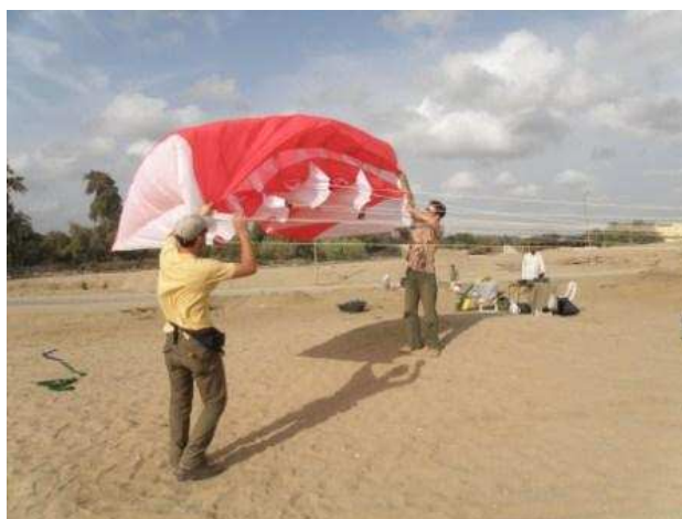
Fot. 1 Zdjęcia lotnicze wykonywane z pomocą latawca